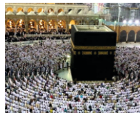
(Kaaba) em Mecca

No tempo de Jesus (que a paz esteja com ele), a direção para orar era para Jerusalém: (João 4:20-21) . Jesus disse que os verdadeiros adoradores, adorarão a Deus em "espírito e verdade": (João 4:23-24) , o que significa "eles serão sinceros em sua adoração", não significa que adorarão a Deus em alguma direção determinada . Jesus cuidadosamente seguia os profetas e rezava em direção ao Templo Sagrado.